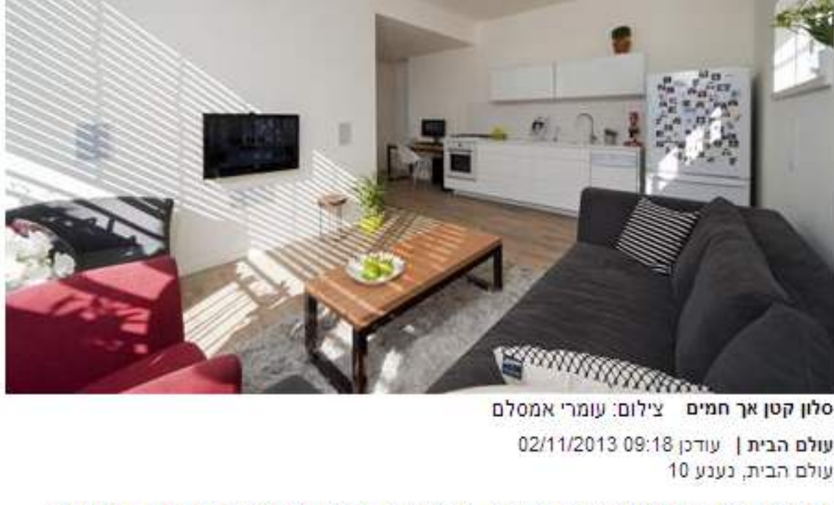
סלון קטן אך חמים

עולם הבית | עודכן 02/11/2013 09:18 עולם הבית, נענע 10