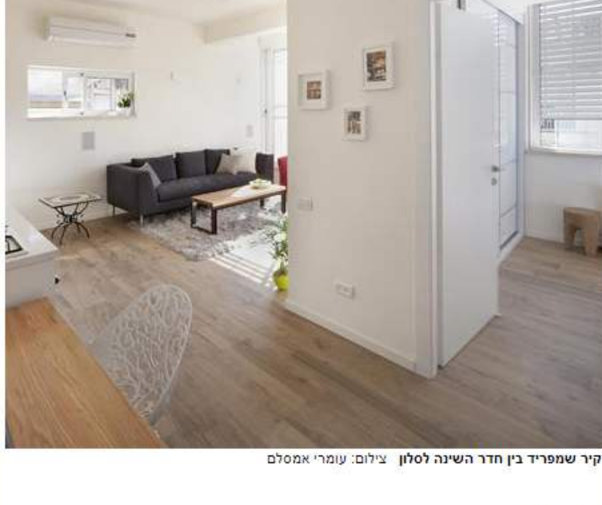
קיר שמפריד בין חדר השינה לסלון

לפני השיפוץ חלל המגורים תפקד כסלון וכחדר שינה לאחר השיפוץ נעשתה חלוקה של הדירה ל-2 חדרים. בתכנון נכון חדר הרחצה והשירותים הועברו לצד הבית, מה שאפשר טיפול נכון בחלוקת החלל ויצירת חדר שינה מרווח כולל ארון גדול וסלון מרווח משולב עם מטבח פתוח. כל מערכת ה"YES" והשמע הוסתרו בארון חדר השינה, כך שהסלון הוגדל על חשבון ריהוט מיותר. ריצוף גרניט פורצלן דמוי פרקט הותקן בכל הבית כולל בחדר הרחצה על מנת לתת לבית מראה אחיד.