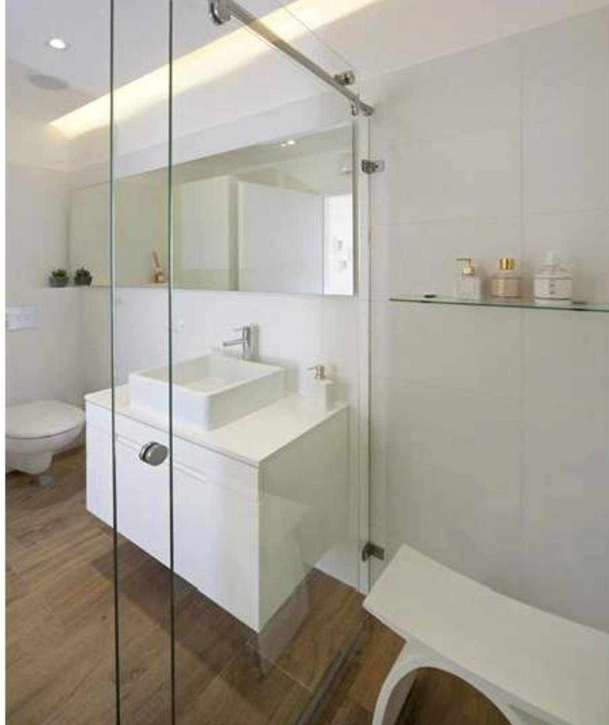
פרקט גם בחדר הרחצה

חדר הרחצה גדול יותר מבעבר, בו יש מקלחון גדול וארון כויר מרחף, כך שניתן לראות את הרצפה ממשיה. בנוסף נתלתה מראה גדולה וארוכה, לכל אורכו של הקיר על מנת להגדיל את החדר.