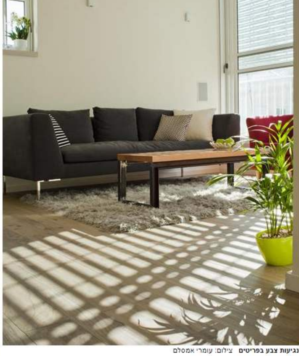
נגיעות צבע בפריטים

בנוסף, השאיפה הייתה להפוך את חלל המגורים הזעיר לבית מרווח, נעים ושיענה על כל הפונקציות הכרחיות לזוג. על מנת למקסם את חלל הדירה בצורה הטובה ביותר, היה צורך להרוס את כל הקירות והבידועם שתפס נפח גדול בכניסה לבית. לא נשאר קיר אחד שהיה לפני כן, למעט הקירות החיצוניים - נתקבל חלל נקי.