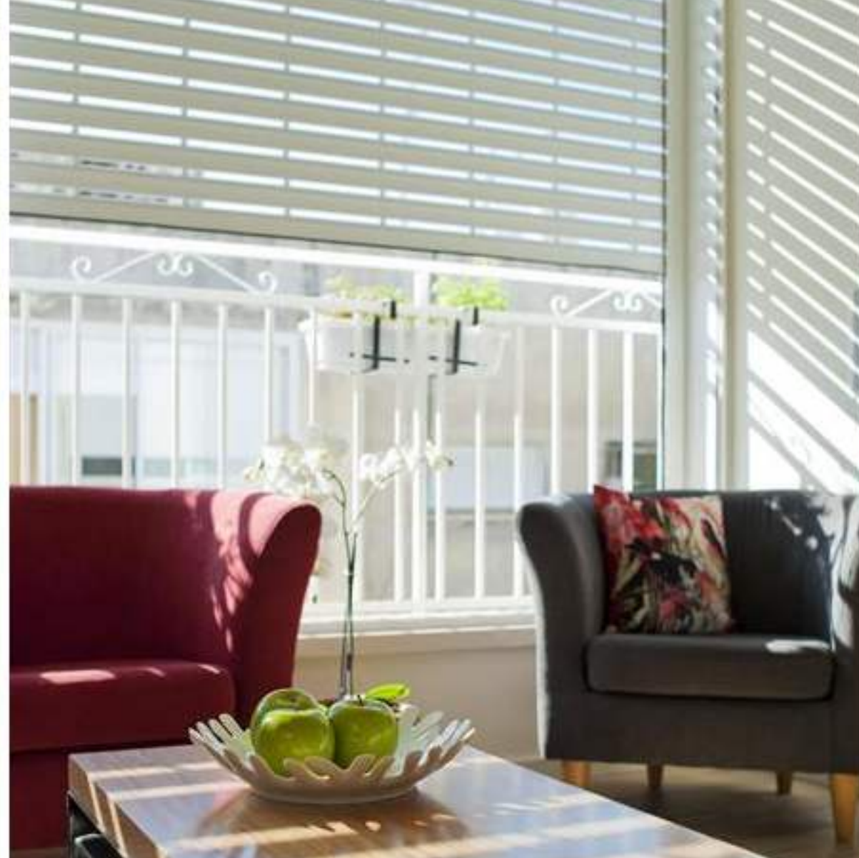
תריסים גדולים המאירים את הסלון

בכל הבית הגשימה המעצבת פנטזיית ילדות של דיירי הבית, שימוש במערכות מוסיקה בזמן המקלחת. כמו כן יש רמקולים גם בחדר השינה ויחידת אודיו בסלון.