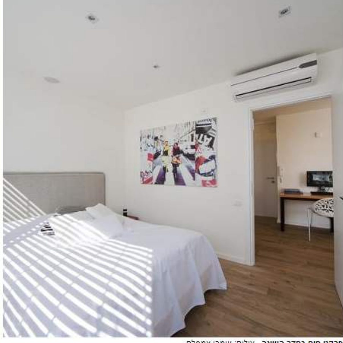
פרקט חום בחדר השינה

המעצבת השתמשה בתאורת קיר, שמאירה מהרצפה אל התקרה תאורת "אפ דאון לייט" ובכך התקרה נראית גבוהה יותר ומאפשרת לחדר להיראות גדול יותר. בחדר שינה יש תאורה רומנטית תלויה לצד המטה.