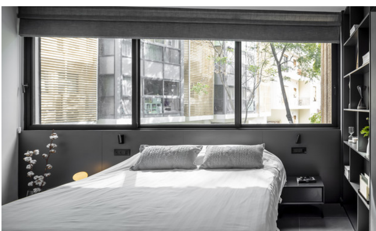
עיצוב נטע'לי נוי