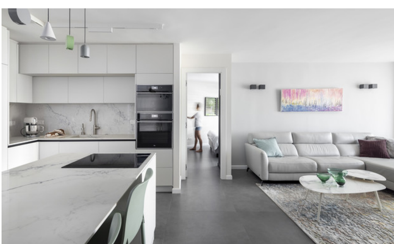
עיצוב נטע'לי נוי