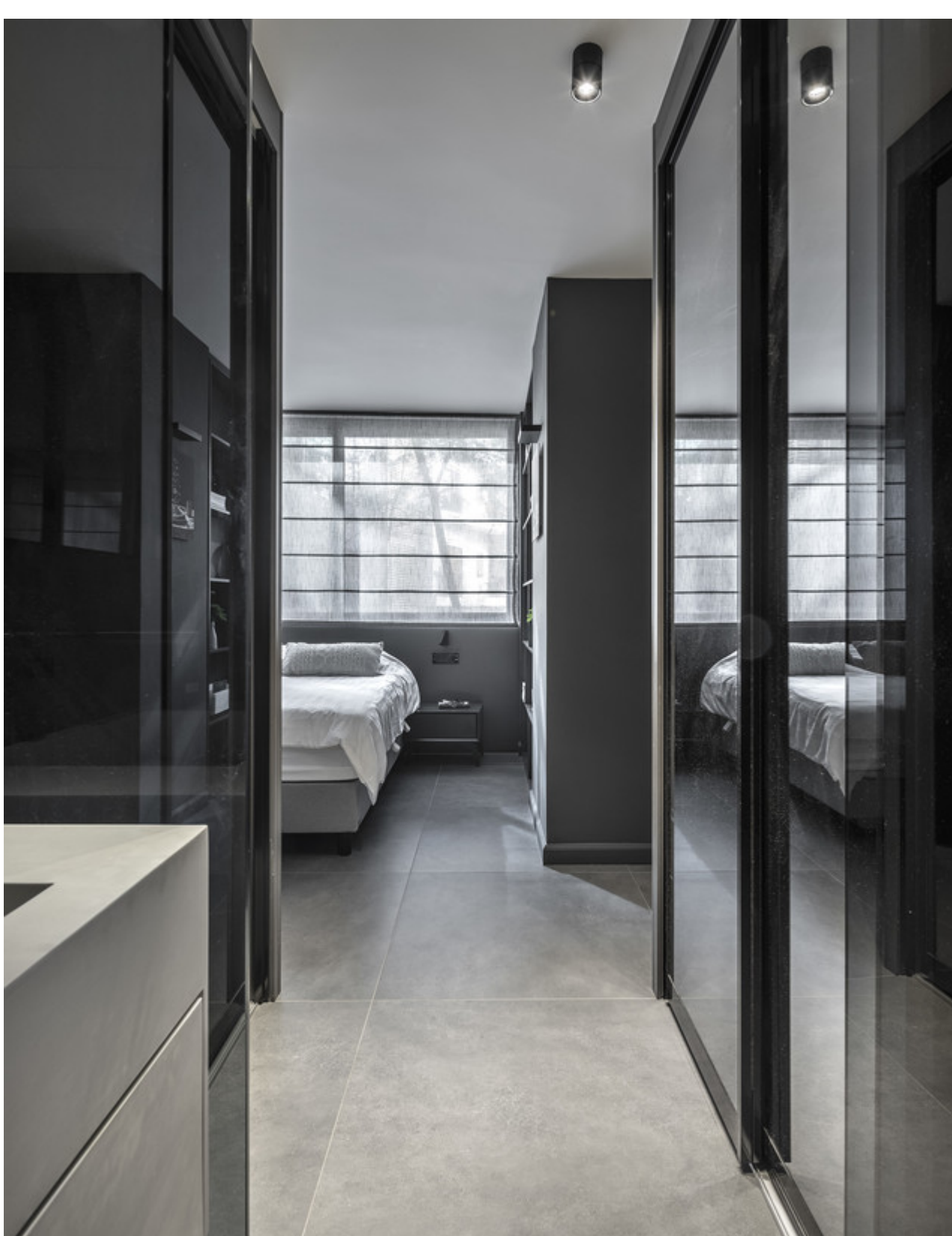
עיצוב נטע'לי נוי