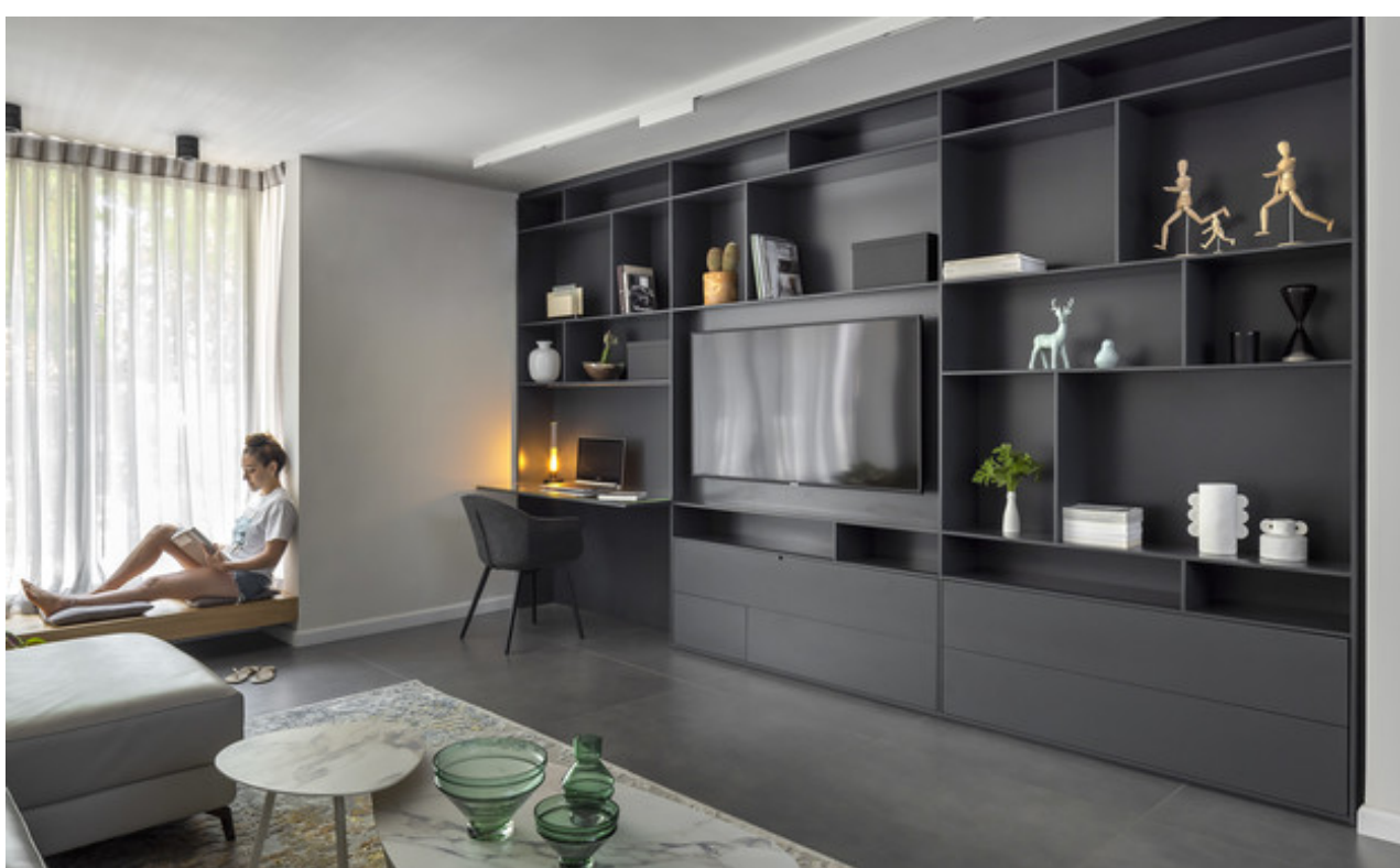
עיצוב נטע'לי נוי

הדירה המשופצת כוללת מטבח עם אי עבודה גדול, קליניקה ושני חדרי שינה המאורגנים באלגנטיות בתוכנית הבניין האלכסונית והמאתגרת. הקירות האלכסוניים נוצלו לאחסון והם מוסווים בעזרת ארונות עץ שתוכננו במיוחד, ובמרפסת הותקנה במה מרחפת המשקיפה אל הגינה.