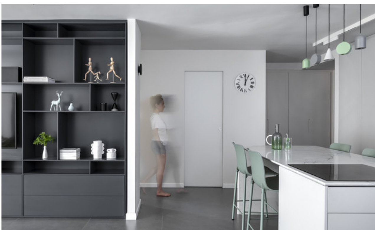
עיצוב נטע'לי נוי